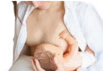
Balón de rugby o pelota de fútbol

La cabeza del pequeño estará apoyada en la mano de la madre.